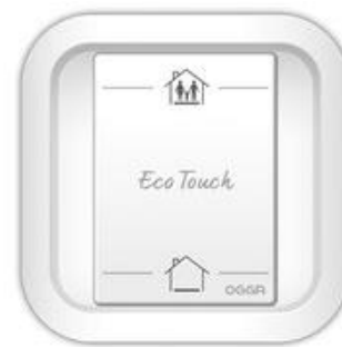
Bouton « présence/absence »