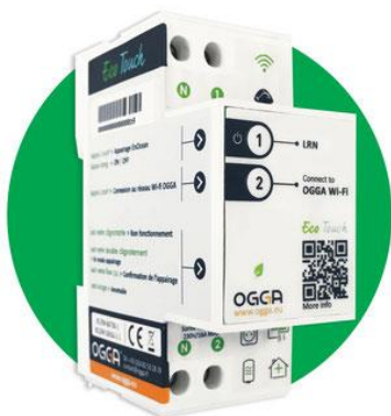
Automate « tout en un »